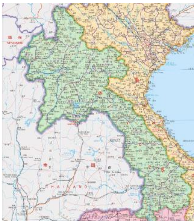
图 1 老挝地图

老挝是位于中南半岛北部的内陆国家，北邻中国，南接柬埔寨，东接越南，西北达缅甸，西南毗邻泰国，国土面积 23.68 万平方公里。湄公河在老挝境内干流长度为 777.4 公里，流经首都万象。